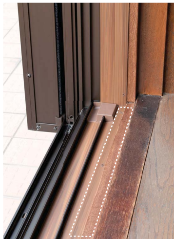
段差がなく、すっきりと納まります。

外観デザインをアップさせるシンプルなモール。モールは枠付けするので、取付け時に壁の防水層を傷める心配がありません。