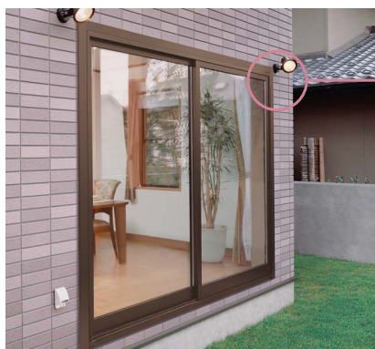
カット部イメージ